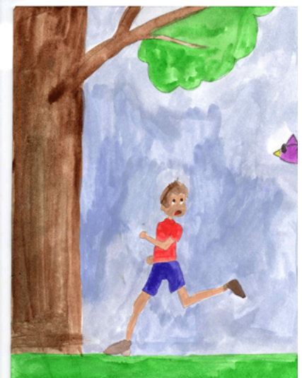
Самира ДОСКУЛОВА, 4 класс

Ярослава ОВЧАРЕНКО, 6 класс, Дарья ВАГНЕР, 6 класс, Самира ДОСКУЛОВА, 4 класс