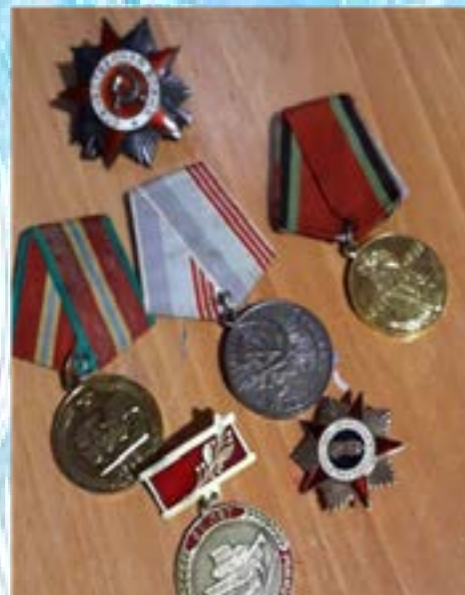
Ордена и медали моего прадеда