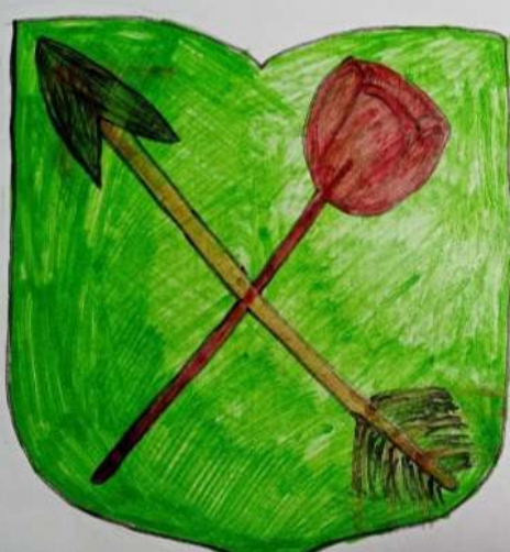
Рисунок Динары АРДЫПОВОЙ 8 класс