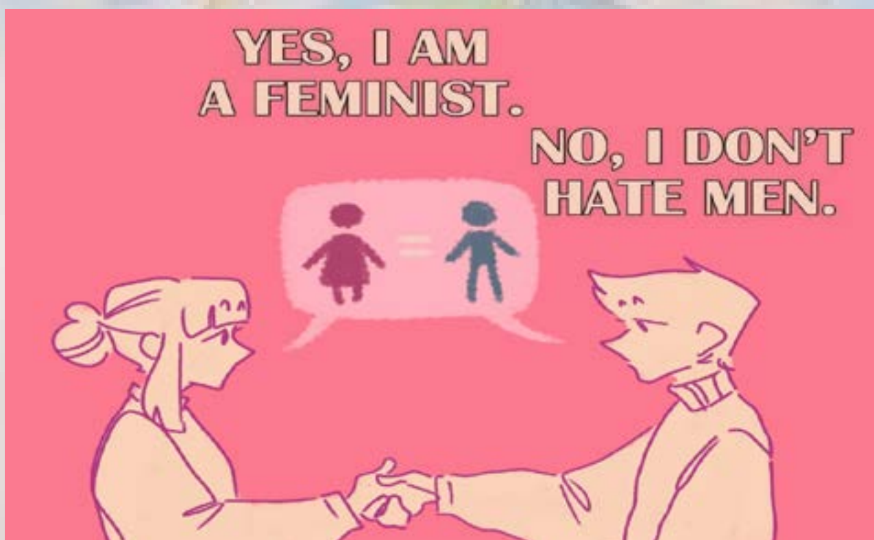
Рисунок Люды ПОСТНИКОВОЙ