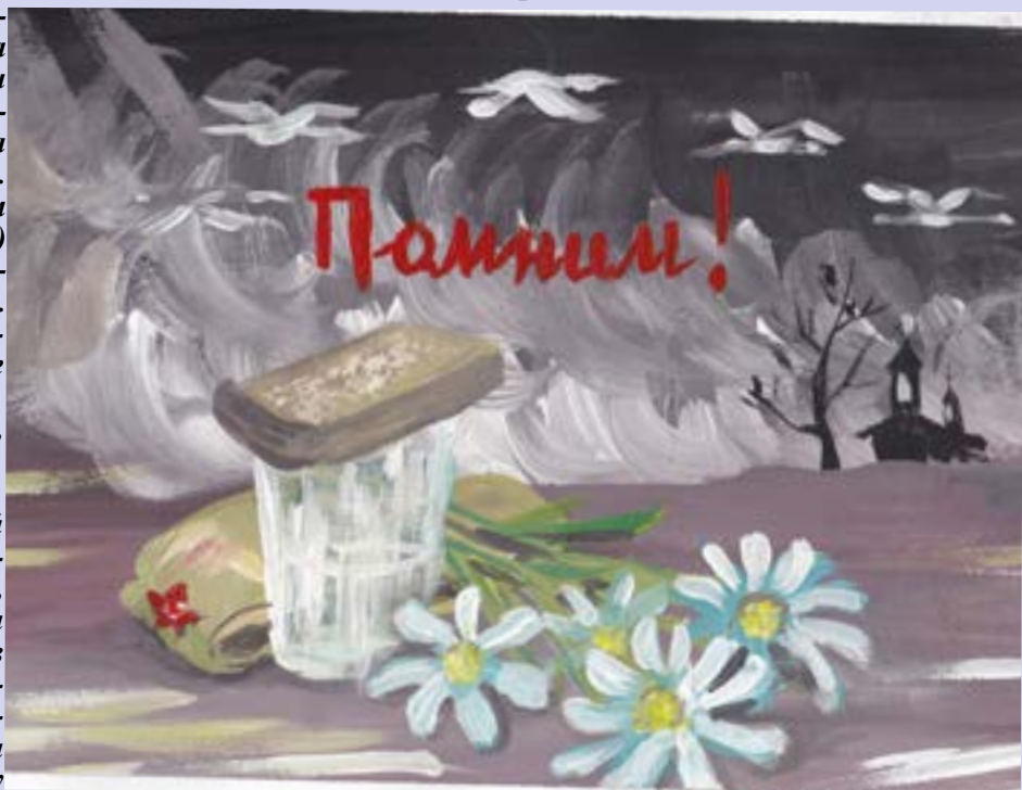
Ксения Желонжина, 10 лет