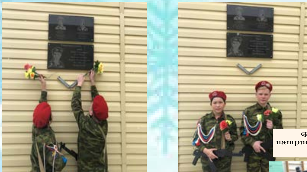
Фоторепортаж о патриотических мероприятиях школы