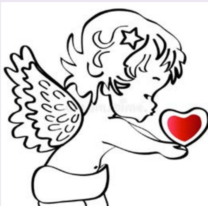
Рисунок ИЗ ИНТЕРНЕТА