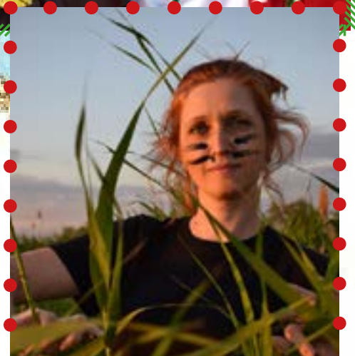
Фото педагогов онлайн-лагеря Креативная лига «С кем поведёшься...»