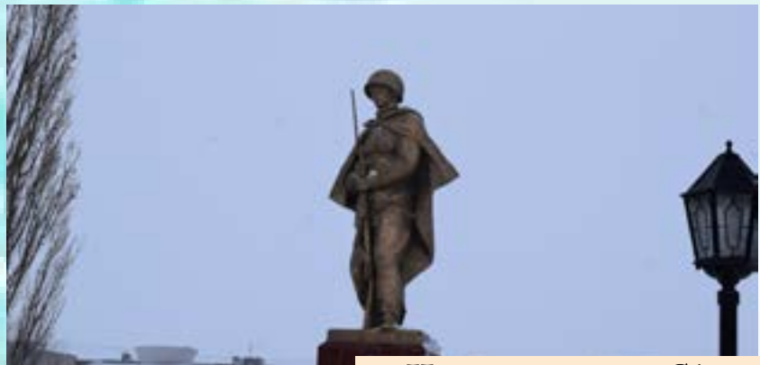
На мемориале «Сквер Славы»