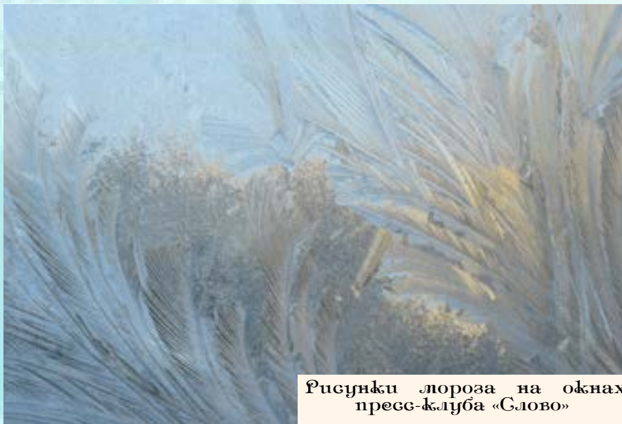
Рисунки мороза на окнах пресс-клуба «Слово»

Полина АЛЁШИНА, 7 класс