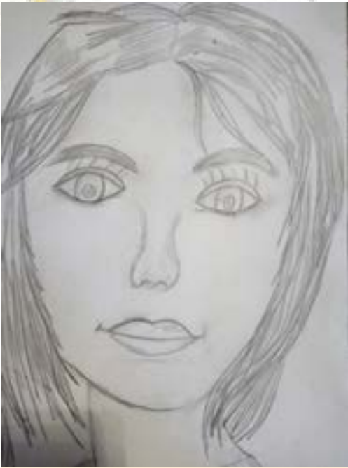
Рисунок Алины МУХАМЕДЖАНОВОЙ

Для меня самым дорогим человеком является моя мама. Она очень заботливая, добрая и красивая. Мама работает в школе. Утром она уходит на работу, а в обед возвращается очень уставшая. Но у неё всегда есть силы, чтобы переделать все домашние дела и позаботиться о нас. У мамы самые нежные и ласковые руки. Мама хочет, чтобы мы хорошо учились и были образованными, а ещё она учит меня быть хозяйкой, ведь я должна уметь делать всё по дому. Каждая мама хочет для своих детей счастья и успехов во всем. Мне кажется, что мы, дети, всю жизнь обязаны нашим мамам, не только из-за того, что они подарили нам жизнь, но и потому, что они всегда будут нас любить и поддерживать.